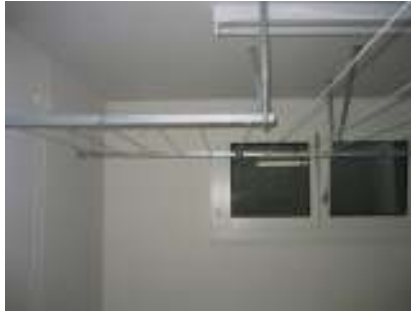
Überbrückungsschienen in jeder Länge erhältlich