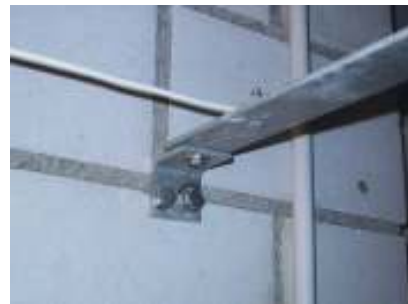
Wandanschlusswinkel seitliche Befestigung