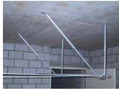
Teleskopträger Türen und Fenster sind kein Hindernis