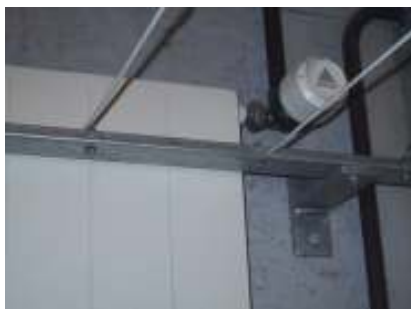
Wandkonsolen kein Hindernis, welches nicht überbrückt werden kann